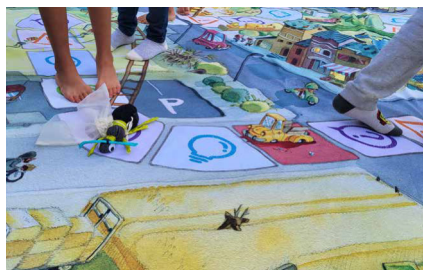
Hexapodia - das am 6. September in Villars-sur-Glâne vorgestellte, neue kollaborative Riesenspiel.

Zahlreiche Kinder und ihre Familien besuchten unseren Stand, den wir im Rahmen von zwei Sensibilisierungsaktionen betrieben. Die erste der beiden Aktionen fand am 30. August an der Ecole du Platy in Villars-sur-Glâne statt, die ihren neuen Biodiversitätspfad einweihte. Unsere Sektion hatte die Ehre, das neue, kollaborative Riesenspiel «Hexapodia», das von Pro Natura entwickelt wurde, vorzustellen. Das Spiel versetzt die Kinder in die Rolle eines Insektes, das eine Stadt mit vielen Hindernissen durchqueren muss. Dabei entdecken sie den Reichtum der Insektenwelt. Die zweite Aktion fand eine Woche später statt. Im Rahmen eines Garten-Workshops im Freiburger Hafen wurde den Besuchern ein riesiges Gänsespiel über Naturgärten angeboten. Diese Aktivität ermöglichte es dem Publikum, sich auf spielerische Weise des Potenzials städtischer Naturräume für Wildtiere bewusst zu werden.