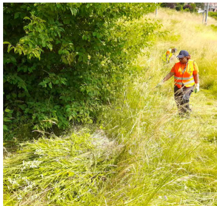
Mehrere Asylbewerber halfen aktiv bei der Bekämpfung der invasiven Goldruten in Villars-sur-Glâne.

Auch im Jahr 2023 setzten wir den Kampf gegen invasive Pflanzen fort. Wir fokussierten dabei auf die Lebensräume, in denen diese exotischen Arten die grössten Probleme verursachen, wie zum Beispiel entlang des Bahndamms in Villars-sur-Glâne. Profitieren konnten diese seit dem letzten Jahr organisierten Ausreissaktionen von einer neuen Zusammenarbeit mit dem ORS. Insgesamt zehn Personen, die einen Asylantrag gestellt haben, nahmen mit grossem Enthusiasmus an den beiden Ausreissaktionen im Juni teil.