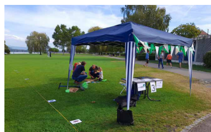
Über 110 Teilnehmende am Thementag vom 17. September in Murten.

Dieses Jahr stand unser mittlerweile traditioneller Themenparcours unter dem Motto «Wasser» und unterstrich die Bedeutung dieses Elements und seiner natürlichen Lebensräume, Seen und Flüsse, für unseren Alltag und die Artenvielfalt. Bei strahlendem Wetter fand die Veranstaltung am 17. September entlang des Seeufers in Murten statt. Mehr als 110 Personen nahmen an dem aus fünf Posten bestehenden Lehrpfad teil und hatten die Gelegenheit, mit den 14 anwesenden Animatoren und Referenten ins Gespräch zu kommen. Die zweisprachigen Animationen boten den Besuchern die Möglichkeit, sich auf die Suche nach kleinen wirbellosen Tieren entlang der Ufer zu begeben oder in die Haut der Blauflügeligen Ödlandschrecke zu schlüpfen, dem Insekt, das von Pro Natura zum Tier des Jahres gewählt worden war und welches die steinigten Ufer von Auenlandschaften mag. Auch das kantonale Amt für Wald und Natur war mit einem Spiel über die Revitalisierung von Wasserläufen und deren Vorteile für die verschiedenen Fischarten vertreten.