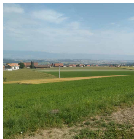
Ein exzentrisches Bauprojekt zielt auf den Hügel von Torny, welcher einen Panoramablick über die Region bietet.

Ansiedlung eines Museums für zeitgenössische Kunst mitten auf dem Land und in der Landwirtschaftszone vorsieht. Die Leschot-Stiftung erhebt wegen des 360-Grad-Panoramas Anspruch auf den Hügel zwischen den Dörfern Torny-le-Grand und Middles. Die Errichtung eines Kunstmuseums weit entfernt von jeglichen kantonalen oder regionalen Tourismuszentren widerspricht jedoch allen Grundsätzen der Raumplanung, die eine Zersiedelung des Landes verhindern sollen. Diese Parzelle, die sich derzeit im Besitz der Armee befindet, sollte stattdessen wieder einer landwirtschaftlichen Nutzung zugeführt werden, die Wert auf die Förderung der Biodiversität legt.