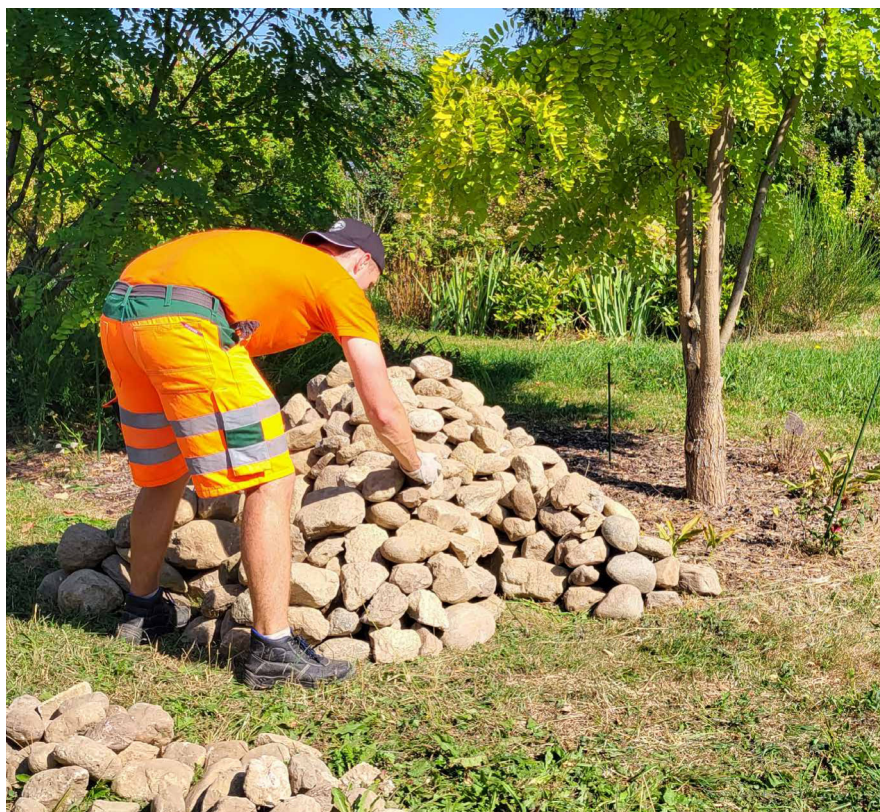
Aufbau von nützlichen Strukturen für Kleintiere in Lentigny mit Hilfe von Asylbewerbern.

Die positive Bilanz dieser fünf Jahre, insbesondere das starke Interesse der Eigentümer sowie das grosse Potenzial für Sensibilisierung und konkrete Massnahmen, die dieses Projekt ermöglicht haben, haben uns dazu veranlasst, das Projekt ab 2024 fortzusetzen. Wir werden insbesondere 13 Aufwertungsprojekte, die aus früheren hervorgegangen sind und Ende 2023 noch in Diskussion waren, weiterverfolgen.