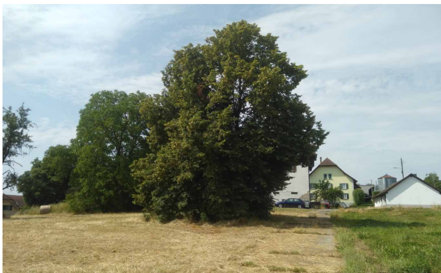
Ein schützenswertes Biotop mitten in der Bauzone von St-Aubin.

Wir haben Rekurs gegen die Entscheidung der Gemeinde Saint-Aubin, die Einsprache gegen den Detailbebauungsplan (DBP) der Laiterie aufzuheben, eingelegt. Tatsächlich sieht dieser DBP die Zerstörung eines schützenswerten Biotops vor, das fünf majestätische Bäume und zahlreiche Arten wie Waldohreulen, Waldkäuze, Grünspechte und Fledermäuse beherbergt. Dieses Biotop wurde im Stadium des Ortsplans (OP) nicht bewertet,