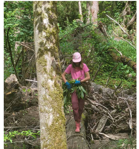
Freiwillige beim Ausreissen von Drüsigem Springkrautpflanzen in Villarepos.

Es ist geplant, die Aktionen gezielt fortzusetzen. Dabei orientieren wir uns an den Empfehlungen des nächsten kantonalen Aktionsplans Neophyten, der genauere Angaben zu den Bekämpfungsmassnahmen in den verschiedenen natürlichen Lebensräumen enthalten wird.