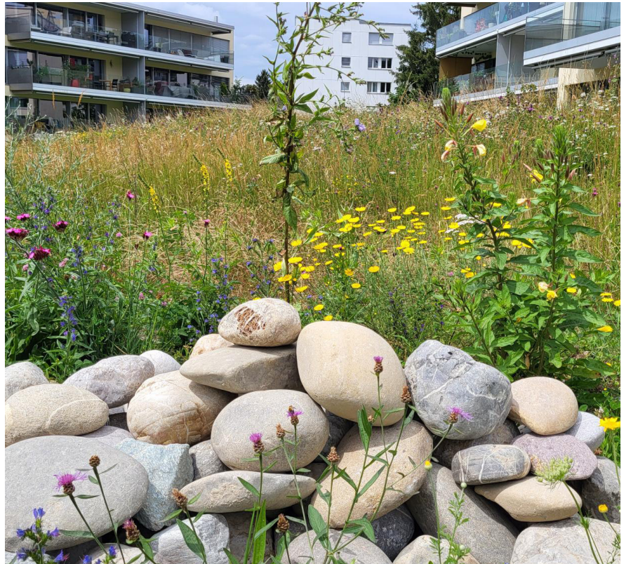
Die Sektion freut sich über eine Reihe von naturfreundlichen Gestaltungsmassnahmen. Diese werden im Rahmen des Projekts zur Aufwertung von Grünflächen auf dem Gelände einer Stockwerkeigentümerschaft im Freiburger Schönberg-Quartier umgesetzt.

Wir hoffen, dass dieses Projekt im Schönberg-Quartier, über das die Medien im Sommer 2024 berichteten, anderen, seien es private Eigentümer:innen, Stockwerkeigentümer:innen oder Hausverwaltungen, als Inspiration dient.