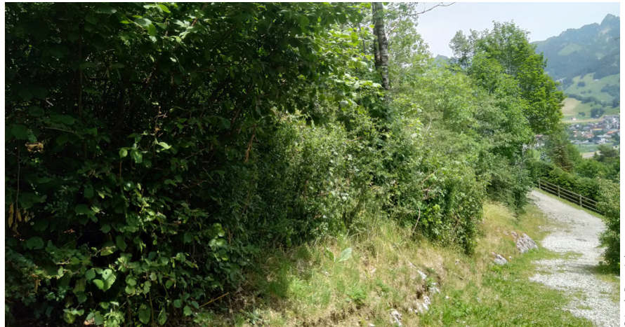
Die Parzelle in Crésuz bietet einen wertvollen Lebensraum für viele geschützte Arten. Wird dieses wertvolle Biotop nun endlich unter Schutz gestellt?

Ein ausgezeichnetes Beispiel für unsere Interventionen im Jahr 2024 ist die Beschwerde, die wir Mitte Juli beim Freiburger Kantonsgericht (KG) einreichten, um die Zerstörung eines sehr wertvollen Lebensraums in Crésuz zu verhindern. Dieser beherbergt insbesondere zwei Vogelarten, die auf der Roten Liste stehen und auf nationaler Ebene Priorität haben. Ein durch ein Bauprojekt für Einfamilienhäuser beanspruchtes Gebiet war nicht als schützenswert in die kommunale Ortsplanung (OP) auf-