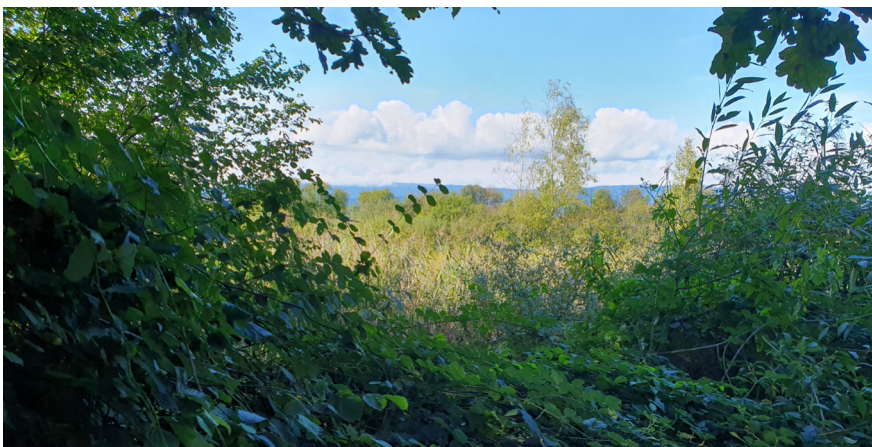
Blick auf das Flachmoor von Fräschels, dem die Sektion einen besseren Schutzperimeter zuweisen möchte.

Das Verbandsbeschwerderecht ist für den Naturschutz von grundlegender Bedeutung. Es ermöglicht, die Interessen der Natur in Projekten rechtsgültig zu vertreten und die Einhaltung der Gesetze zum Natur- und Umweltschutz durchzusetzen. Während seiner Herbstsession beschloss das Parlament, den Umfang dieses Rechts zu reduzieren. Das betrifft «kleinere Wohnbauprojekte», also solche mit einer Geschossfläche von weniger als 400 m 2 . Die Parlamentsdebatten zielen darauf ab, Verbände daran zu hindern, sich auf den Europäischen Gerichtshof für Menschenrechte zu berufen. Wir stellen fest, dass das Recht, der Natur eine Stimme zu verleihen, immer weiter eingeschränkt wird.